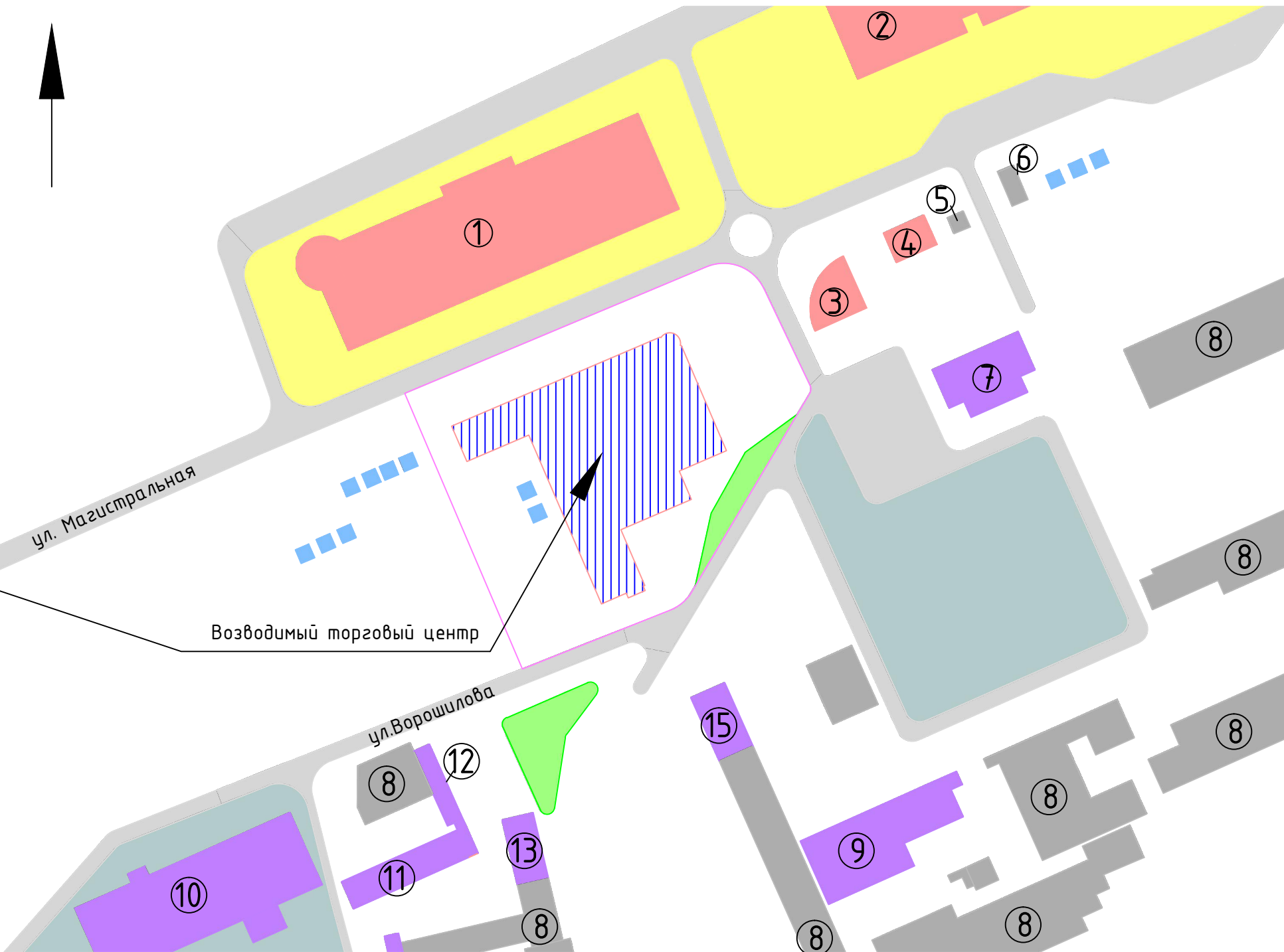
Опорная схема М 1:2000