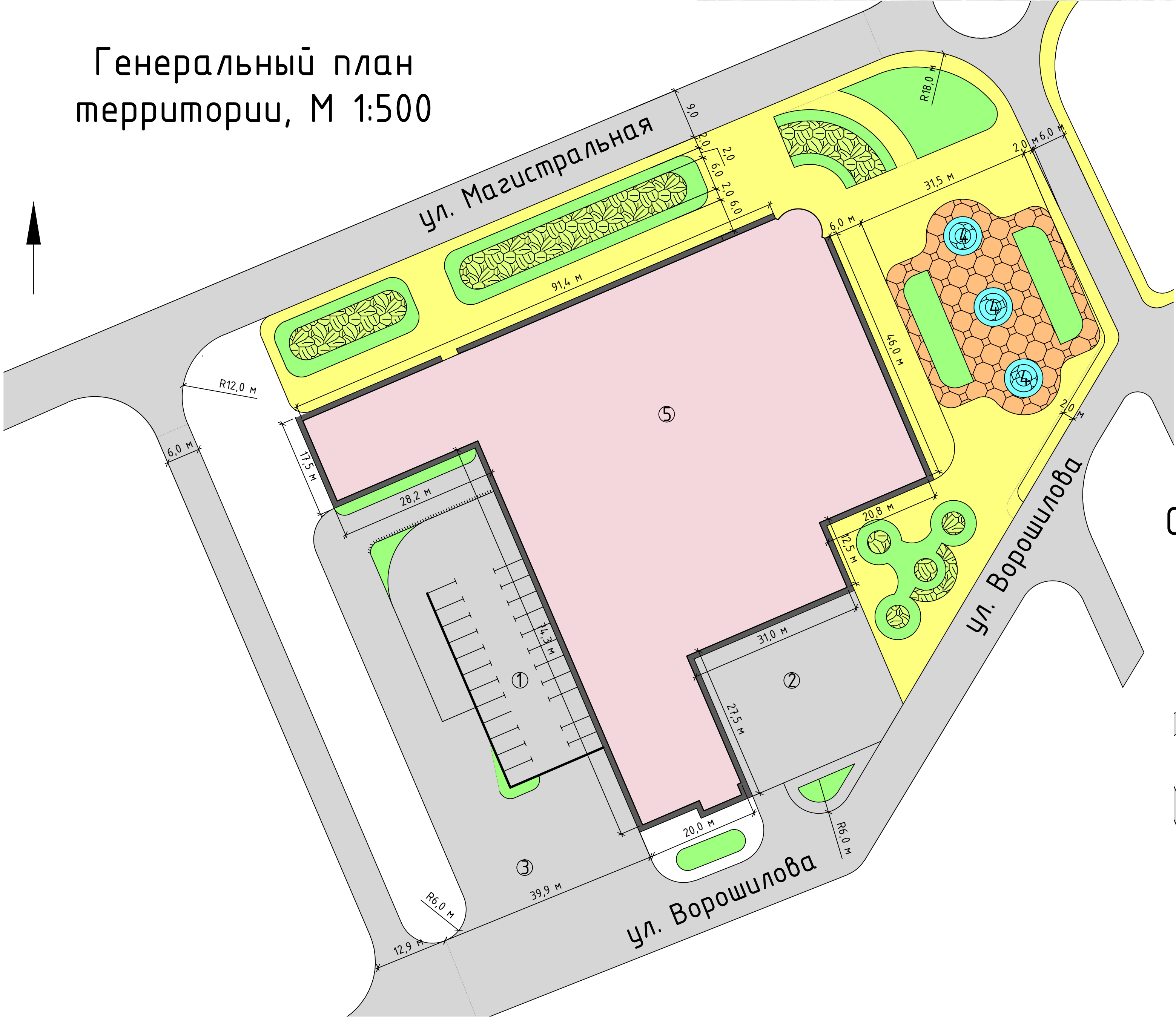
Генеральный план территории, М 1:500