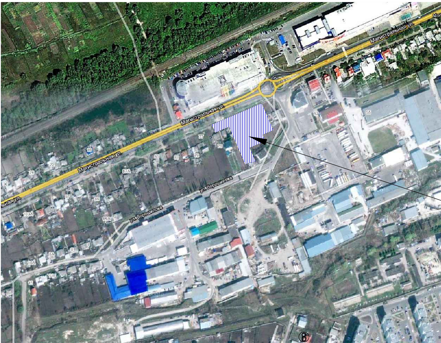
Ситуационная схема (спутниковый снимок)